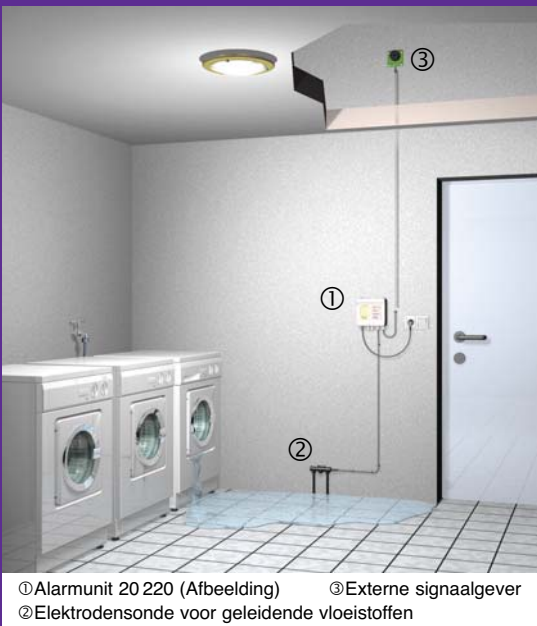
① Alarmunit 20 220 (Afbeelding) ③ Externe signaalgever ② Elektrodensonde voor geleidende vloeistoffen